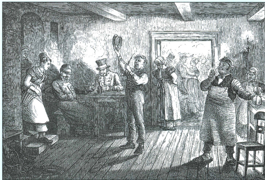
En Kjælderdansebod - tegnet af P. Klæstrup.

"Der var et Utal af Danseboder og Dansebuler i sin Tid i København, thi Danselysten var da som nu stor, omend der dansedes under ganske andre Former. Man begyndte paa Datidens Danseboder temmelig tidlig, og Publikummet var selvfølgelig forskelligt efter det Niveau, som vedkommende Dansebod indtog. Paa nogle Steder var det gennemgaaende et forholdsvis pænere Publikum, der kom, og man kunde saaledes her træffe en Del Tjenestepiger, der med Torvekurven eller Torve-spanden paa Armen var sendt i Byen af deres Madmoder (Butikkerne havde nemlig den Gang længe aabent) og saa benyttede den gunstige Lejlighed til at smutte ned i Dansekælderen. Datidens Danseboder var for det meste i Kældere. Men ogsaa gifte Koner søgte bag Mandens Ryg at faa deres Danselyst styret ved i al Hemmelighed at liste dermed, uden at Manden opdagede det. Selvfølgelig kom der ogsaa en stor Del letlevende Damer her, som ikke stod under Politiets Opsigt, og adskillige af disse fik lokket unge Mennesker af pænere Familie "paa Galejen", som man udtrykte sig i sin Tid....."